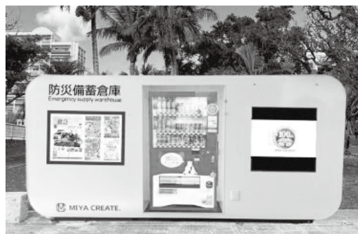
流通在庫備蓄倉庫設置予定図