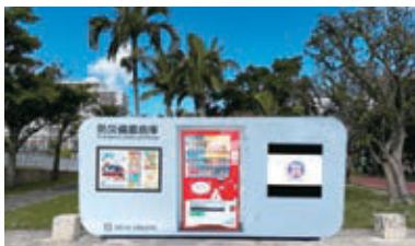
流通在庫備蓄倉庫設置予定図